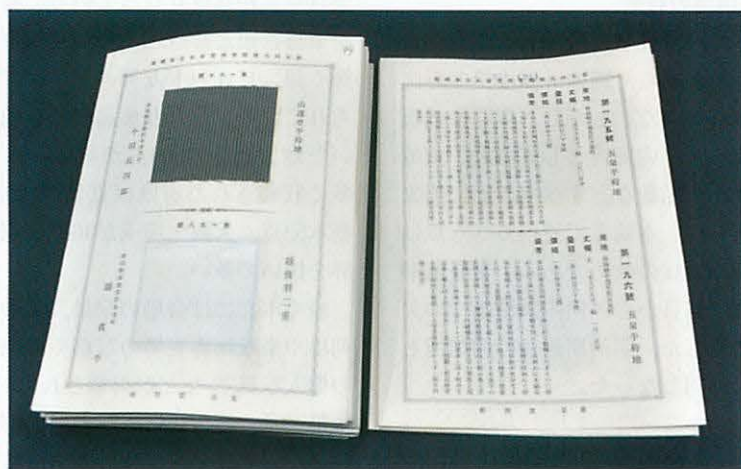
図3 『第五回内国勸業博覧会紀念染織鑑』紀念収集品類 (一部)