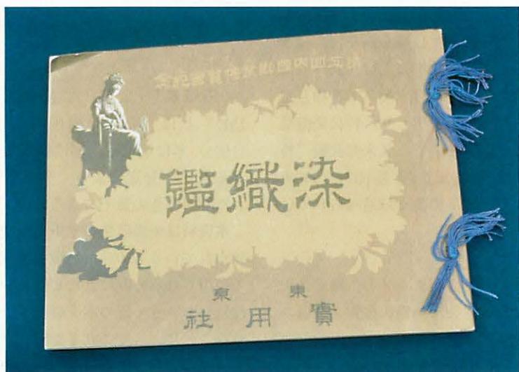
図1 『第五回内国勸業博覧会紀念染織鑑』表紙