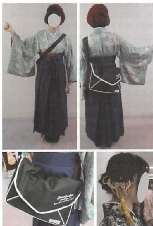
図40 ストリート系/スポーツバッグ、ベレー帽を用いた着装事例

っている実態がカタログ及び学生の着装分析から理解できた。また本来は洋服に合わせるブーツは、袴の着装では定番であることも垣間見えた。まだ断片的な資料ではあるが、学生とのブレーストーミングを通して「和」「洋」を取