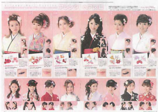
図23 ヘスタイル、メイクの掲載事例