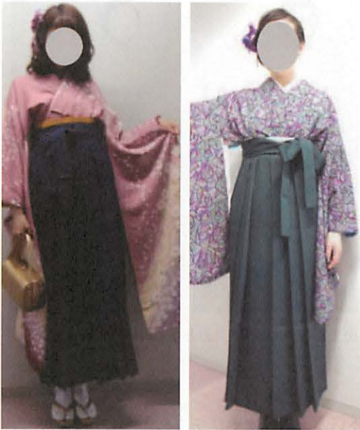
図33 混在系／足元の見え方(袴の長さを短めに着用)にこだわった着装事例