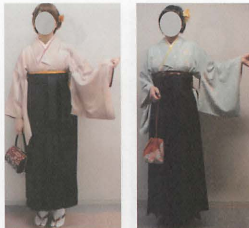
図 3 8 ノンポリ系／おとなしめの着装事例

実態が読み取れる。他のクラスターと比較すると、特に奇抜な又は個性が強くなるアイテムを選択している様子は何えない。