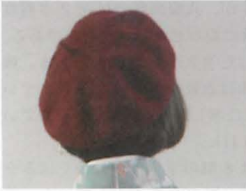
図 10-1 ベレー帽