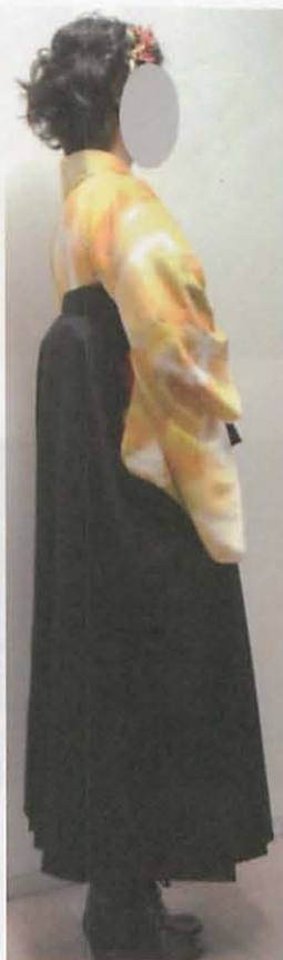
図 3 - 7 E 袴丈 (ブーツ着用時)