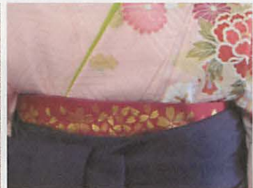
図7-3 柄のある半幅帯