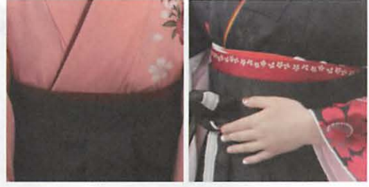
図15 左：均一幅の半幅帯 右：不均一な幅の半幅帯