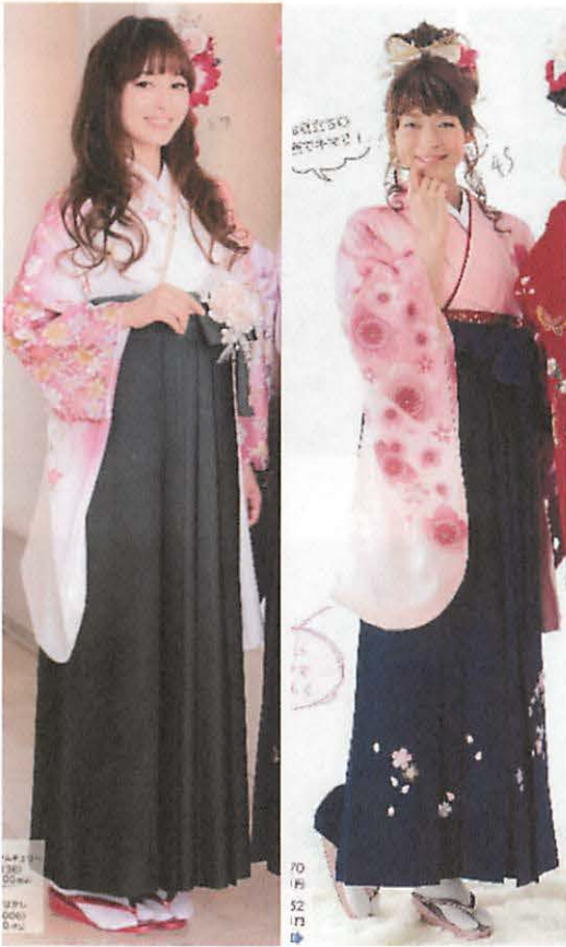
図25 着物、袴、足元、頭において最も多い組み合わせの事例 (1) 『Hakama』より転載 (2) 『はかま』より転載