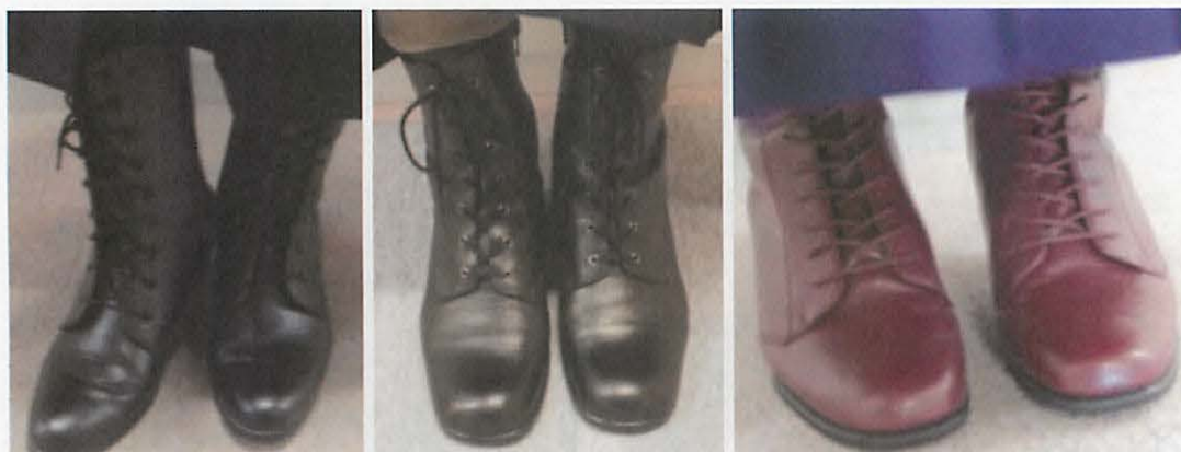
図 27 着用しているブーツの事例