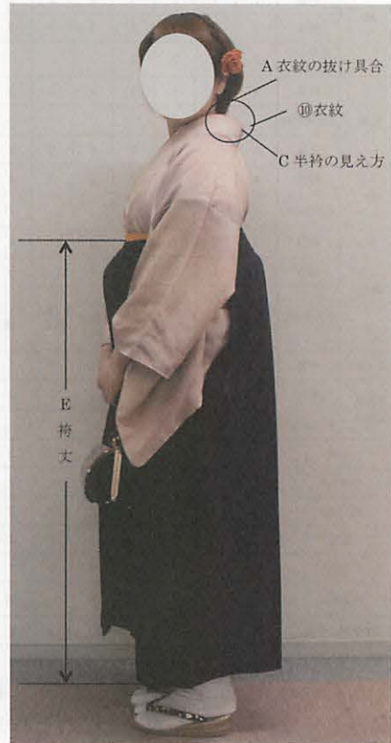
図 2 - 2 袴姿の名称 (側面)