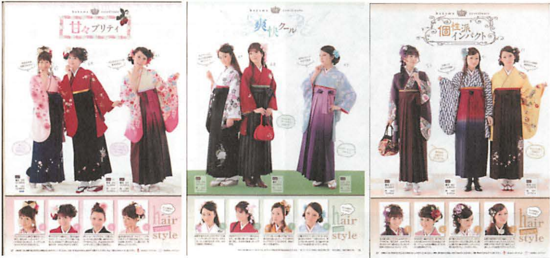
図20 ファッション・テイスト別掲載事例 『はかま』より転載