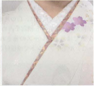
図6-3 柄入りの伊達袴