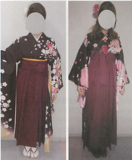
図 18 左：適当な補正 右：補正がされていない

丈については「草履着用時の袴丈よりも短く」など、明確な丈が記載されていないものも見られる。このように着付けをする側の感覚に任せる曖昧な部分があるため統一の無い着付けが多くみられたのではないかと推察する。