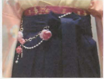
図 10-3 チェーンの装飾品