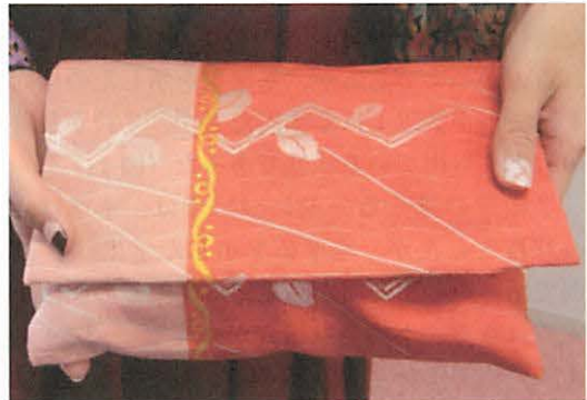
図9-2 着古した帯を仕立て変えたクラッチバック