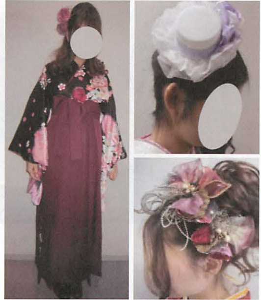
図34 萌え・ギャル系／奇抜でデコラティブなアイテムを用いている着装事例