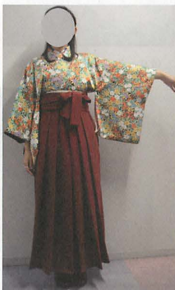
図 4 - 2 普通袖