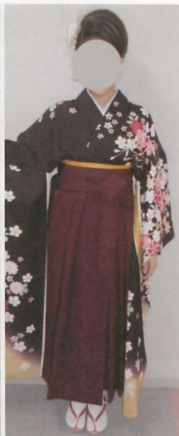
図 3 - 8 F 補正