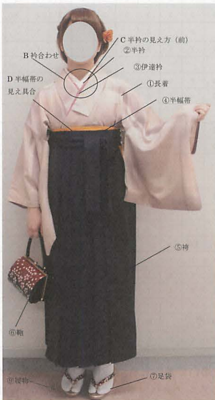
図 2 - 1 袴姿の名称 (前面)