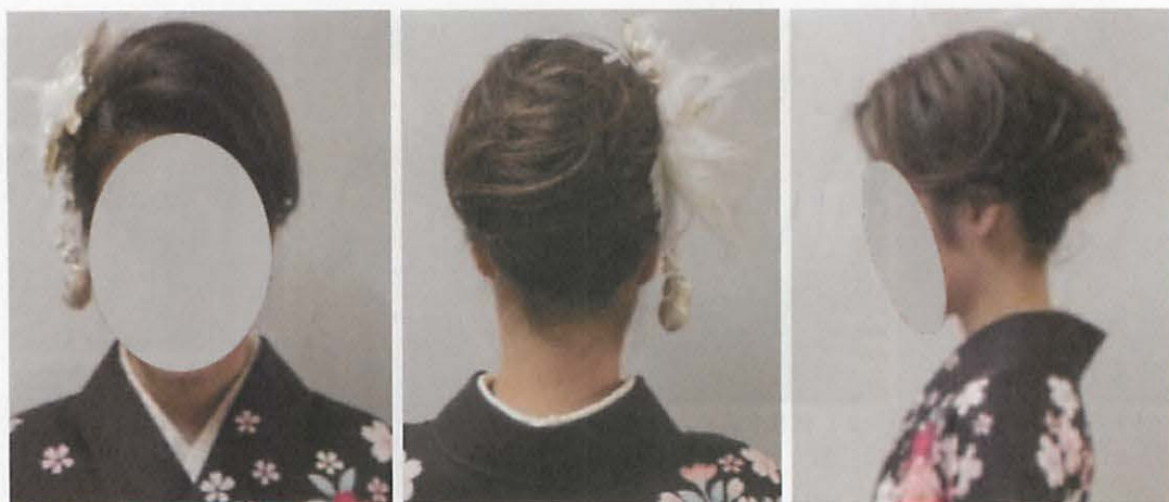
図 3 6 萌え・ギャル系／古典的な髪型の事例