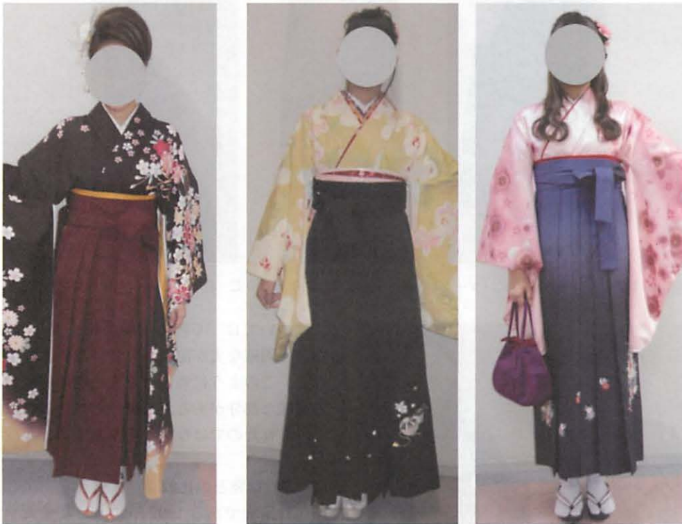
図16 左：基準の袴丈（草履） 中央：足の甲が見えない袴丈 右：くるぶし丈

く袴丈が長い場合などは着用者の寸法に適していないことが考えられる。女性用の長着はおはしより分が含まれるため、ある程度の丈の調整が可能である。一方袴は構造上袴丈にゆとり分を加えず、着用者本人の着丈に合わせて仕立てるため、丈の調整が出来ない。また着用の機会がほとんどない袴はレンタルや既製品を使用することが多く、大まかなサイズで区分され、自