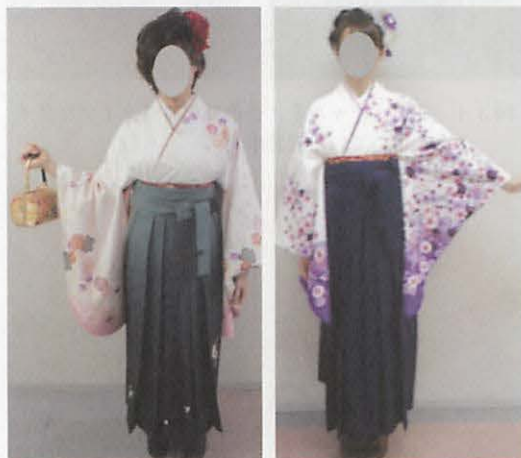
図 3 7 ノンポリ系／現代の袴スタイルの流行を反映した着装事例