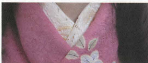
図 5 - 1 レースの半衿