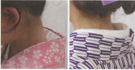
図14 左：後衿中心で控えられた半衿 右：長着から出ている半衿