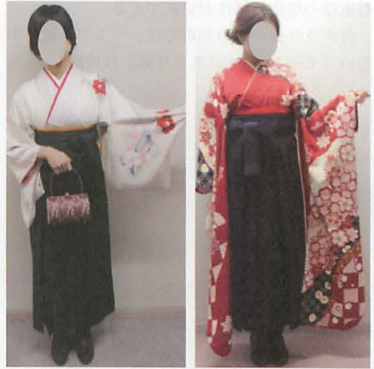
図 3 1 混在系/主流となっている着物と袴は「和風」の着装事例

や他学生からの評価で「お洒落さん」と称され、広い視野でファッション情報収集を積極的に行っている層である。前者の袴の装いは、(図 32) のように例えば袴の選択が、山本寛斎の「Kansai」や伊達袴を何枚も重ねていたりなどのこだわった装いが目立つ。後者の袴の装いは、一般にみられる袴の長さでの着用の仕方ではなく、足元の見え方を考えて着こなしをしている様子がうかがえる。(図 33) は、袴の長さを短めに着装している事例である。