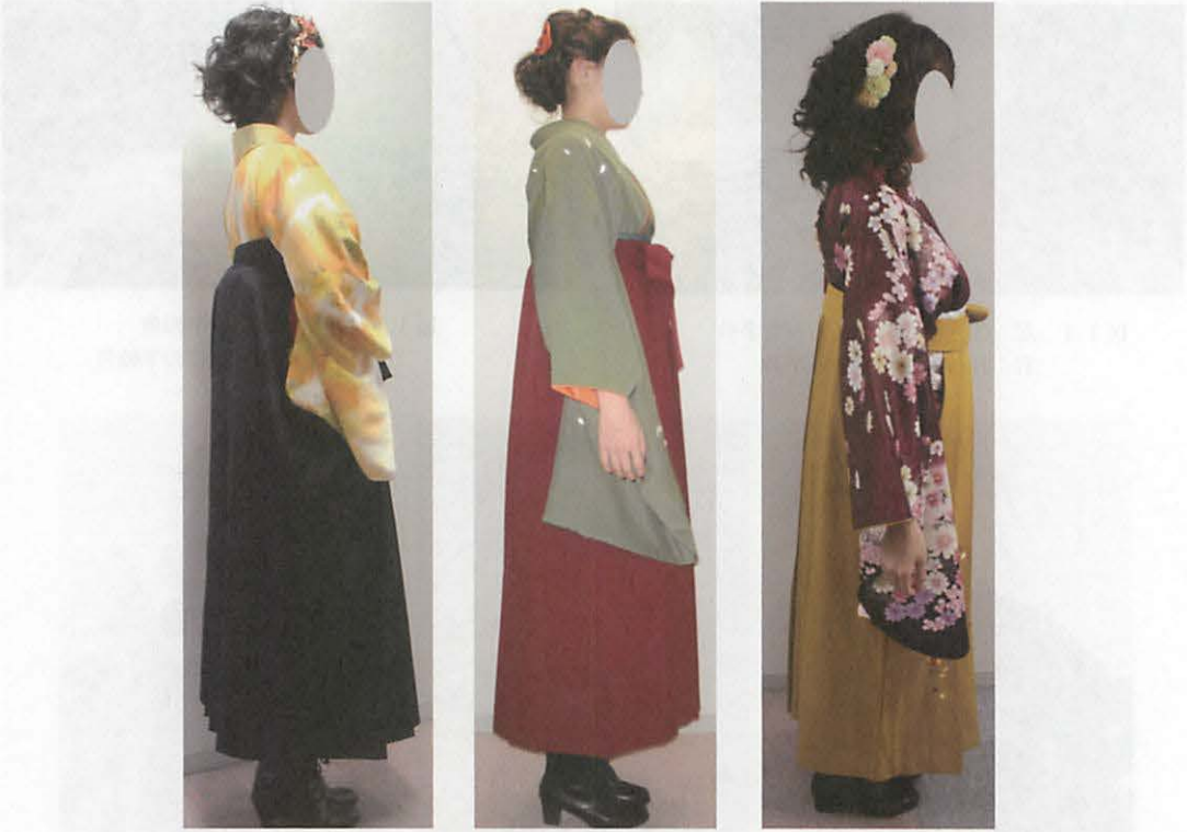
図 17 左：基準の袴丈（ブーツ） 中央：くるぶしより上の袴丈 右：くるぶしよりも長い袴丈