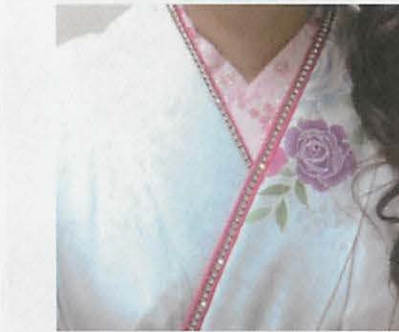
図6-5 ラインストーンが施された伊達袴