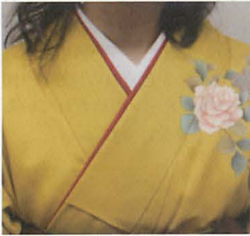
図6-1 単色無地の伊達袴

前述の草履着用者は白足袋を用いるのが主流であるが、少数ではあるが総柄足袋(図8-1)やレース足袋(図8-2)、ワンポイントの模