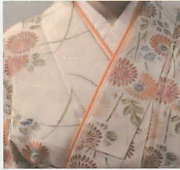
図6-2 2色無地の伊達袴