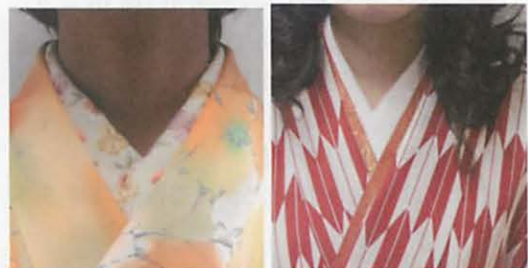
図 12 左: 袴着用の衿合わせ 右: 浅く合わせられた衿合わせ