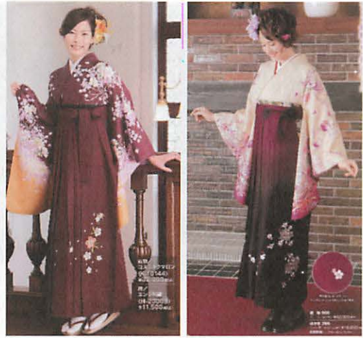
(1) 足元は「和風」 頭は「洋風」 (2) 足元は「洋風」 頭は「洋風」