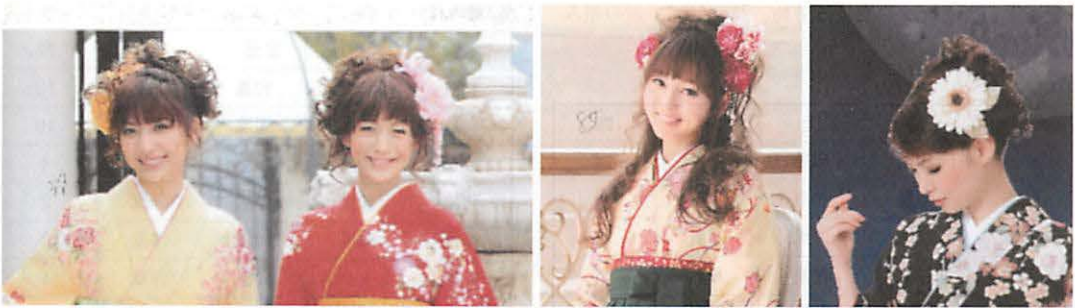
(1) 毛先をカールしたアップスタイル