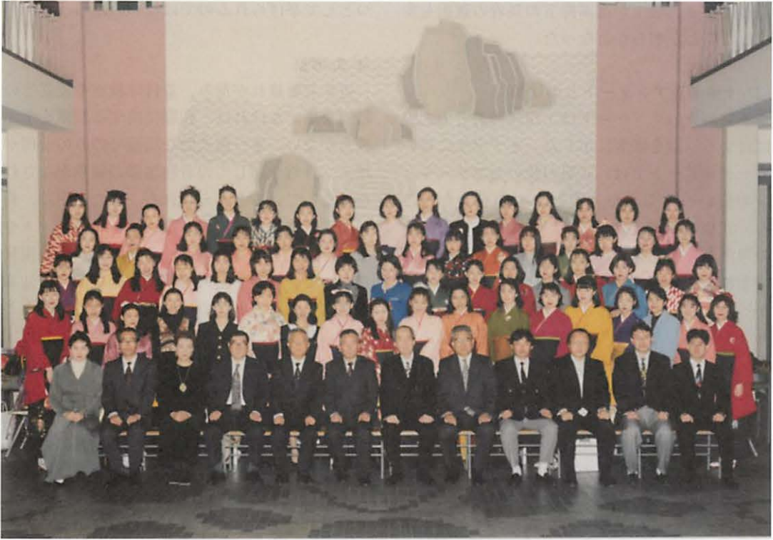
図19 1996年度共立女子大学卒業式写真

ら本研究へと年数を経て卒業式の袴姿の定義及び認識も同様に変化をしたのか否かを、先行研究の約10年前、先行研究の年、本調査の2年前に出版された資料で検討する。