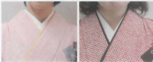
図 13 左: 基準の半衿の見える分量 右: 左右非対称の半衿

た後衿中心で半衿は長着の衿より 0.5 cm 控えられるのが基準であるが、基準値を示したのは約 4 割で、半数以上は基準満たさず、半衿が長着の衿よりも出ている状態であった (図 14)。