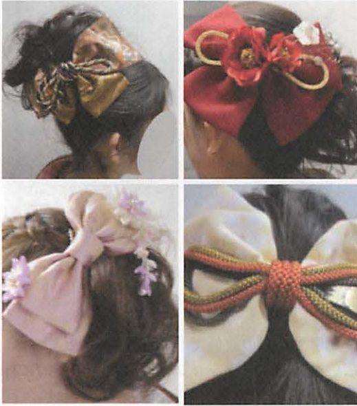
図30 大きなりボンの髪飾りの事例

各クラスター別の分析では、サンプル数が少ない「モード系」「ゴスロリ系」は排除し、「混