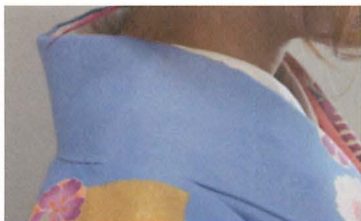
図 3 - 1 A 衣紋