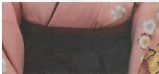
図 3 - 5 D 半幅帯の見える分量

袴の着装の分析をするために、基準となる着装を設定した。資料として用いたのは「装道きもの学院テキスト高修皆修課程実技編」 8) 「美しいキモノ No.123」 9) 「よくわかるきもの着付けと帯結び」 10) 「きもの教本」 11) である(表 2)。統一見解が得られない項目もあるが多数見解、類似見解、または記載が一つのものをまとめて基準とした。A 衣紋は首から指 2 本程度(図 3 - 1)。B 衿合わせは深めに衿が合わせられ鎖骨のくぼみが隠れる程度(図 3 - 2)。C 半衿は前身頃の衿合わせの位置で 1.5 ~ 2 cm 程度