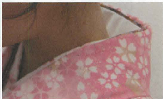
図 3 - 4 C 半衿 (背面)