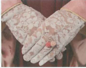
図 10-2 レースのグローブ