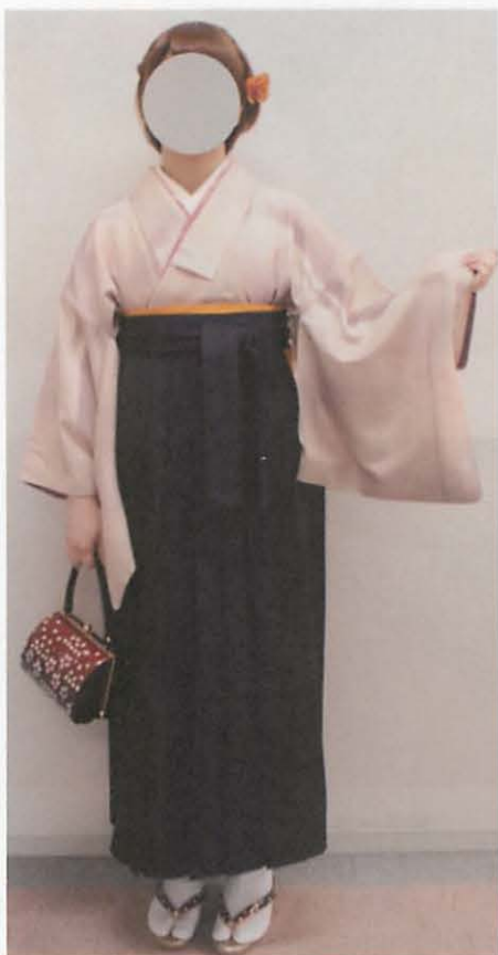
図 3 - 6 E 袴丈 (草履着用時)