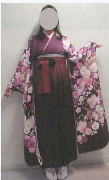
図 4 - 3 大振袖