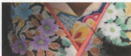
図 5 - 2 染による絵付けの半衿