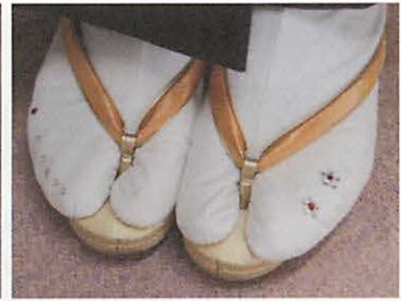
図8-3 ワンポイントの模様がある足袋