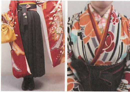
(1) 「Kansai」の袴 (2) 何枚も重ねた伊達袴