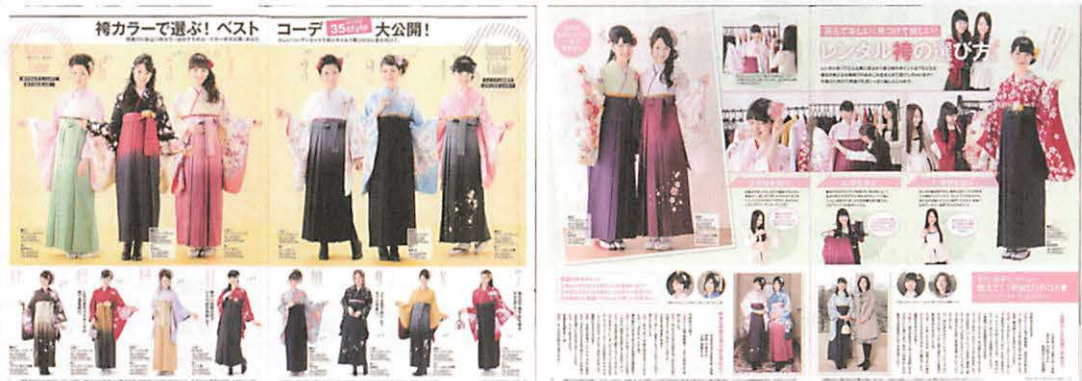
図21 <How to>に分類した掲載の事例 『Hakama』より転載