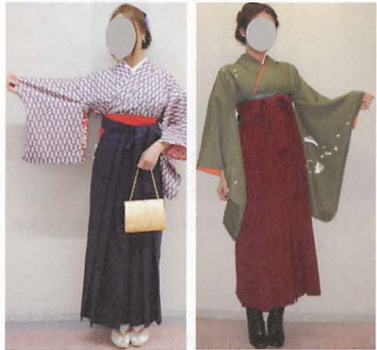
図35 萌え・ギャル系／「和風」の印象が強い着装事例