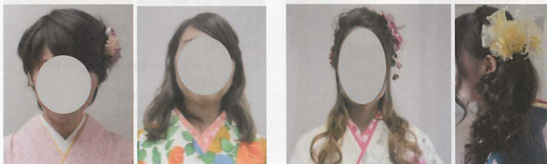
図 28 「和風」の頭の事例