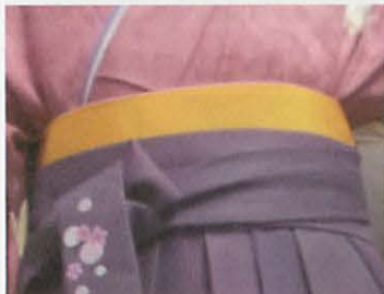
図7-1 アクセントとなる色の半幅帯