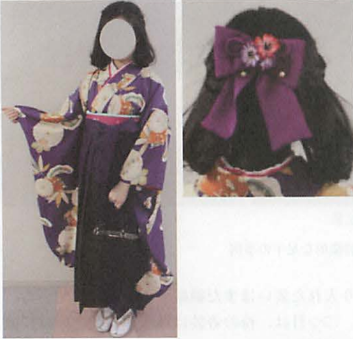
図 4 1 袴のトレンド要素を取り入れた着事例