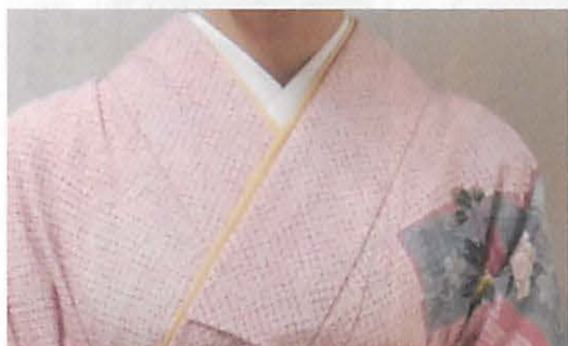
図 3 - 3 C 半衿 (前面)