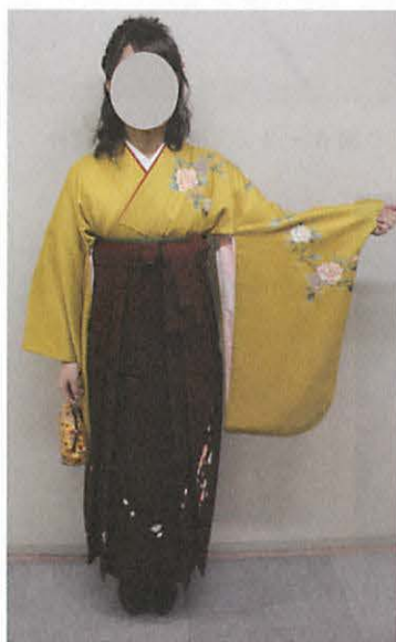
図 4 - 1 小振袖

伊達衿は半数の学生に使用がみられた。伊達衿の種類に着目すると単色の無地が 6 割を占め (図 6 - 1)、次いで 2 色の無地が 2 割であった (図 6 - 2)。少数であるが柄の施された伊達衿 (図 6 - 3) や 3 色重ねの伊達衿 (図 6 - 4)、縁にラインストーンの施されている伊達衿 (図 6 - 5) も見受けられた。