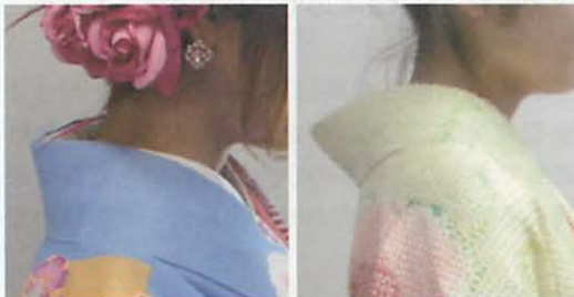
図 11 左: 袴着用の衣紋 右: 多く抜かれた衣紋