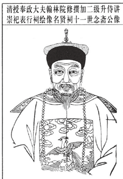
図 5-2 繆彤の肖像（「清授奉政大夫翰林院修撰加二級昇侍講崇祀表行祠繪像名賢祠十一世念齋公像」繆幸龍主編『江陰東興繆氏家集』上海古籍出版社，2014 年，368 頁）

さて、趙観男の例にもどりた。趙観男は繆曰藻の娘と結婚して入贅した。繆曰藻は康熙21（1682）年に生まれた。そのとき父・繆彤は56歳であり 52 、母は側室・李氏であった 53 。繆曰藻は正確には繆彤の次男であったが、兄が夭折したので長男とされている 54 。繆曰藻が官職についていたのは18年間に満たない。順天郷試を3回主宰し、会試の考官を1度つとめ、国史・実録の纂修に3回加わったが、政績は平凡で称賛すべきところはなく 55 、後世の