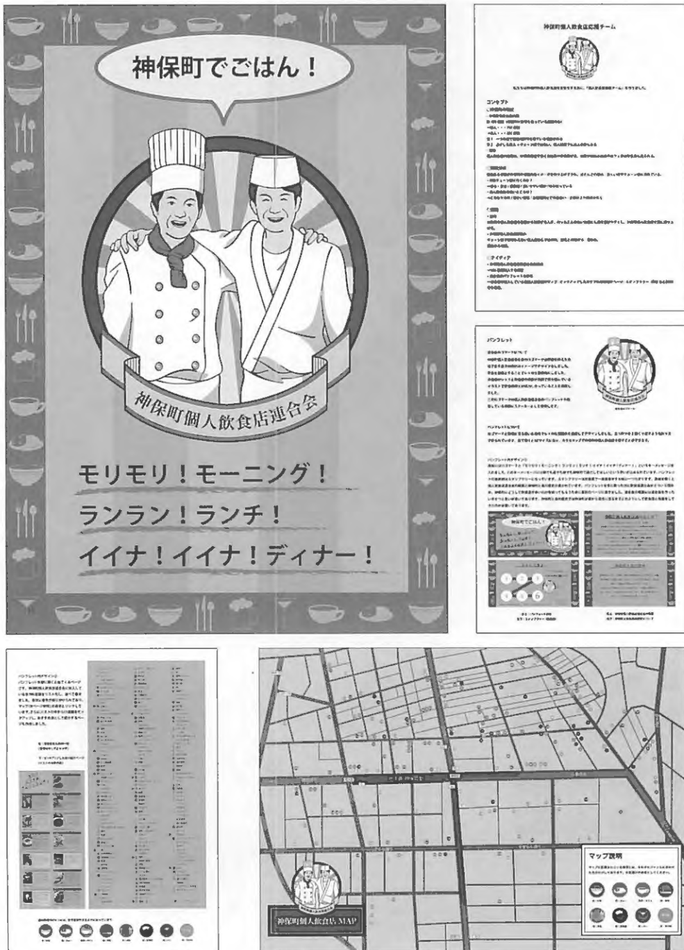
図6 神保町周辺活性化デザイン計画2016

キーメッセージ:「神保町でごはん! モリモリモーニング! ランランランチ! イイナイイナディナー!」