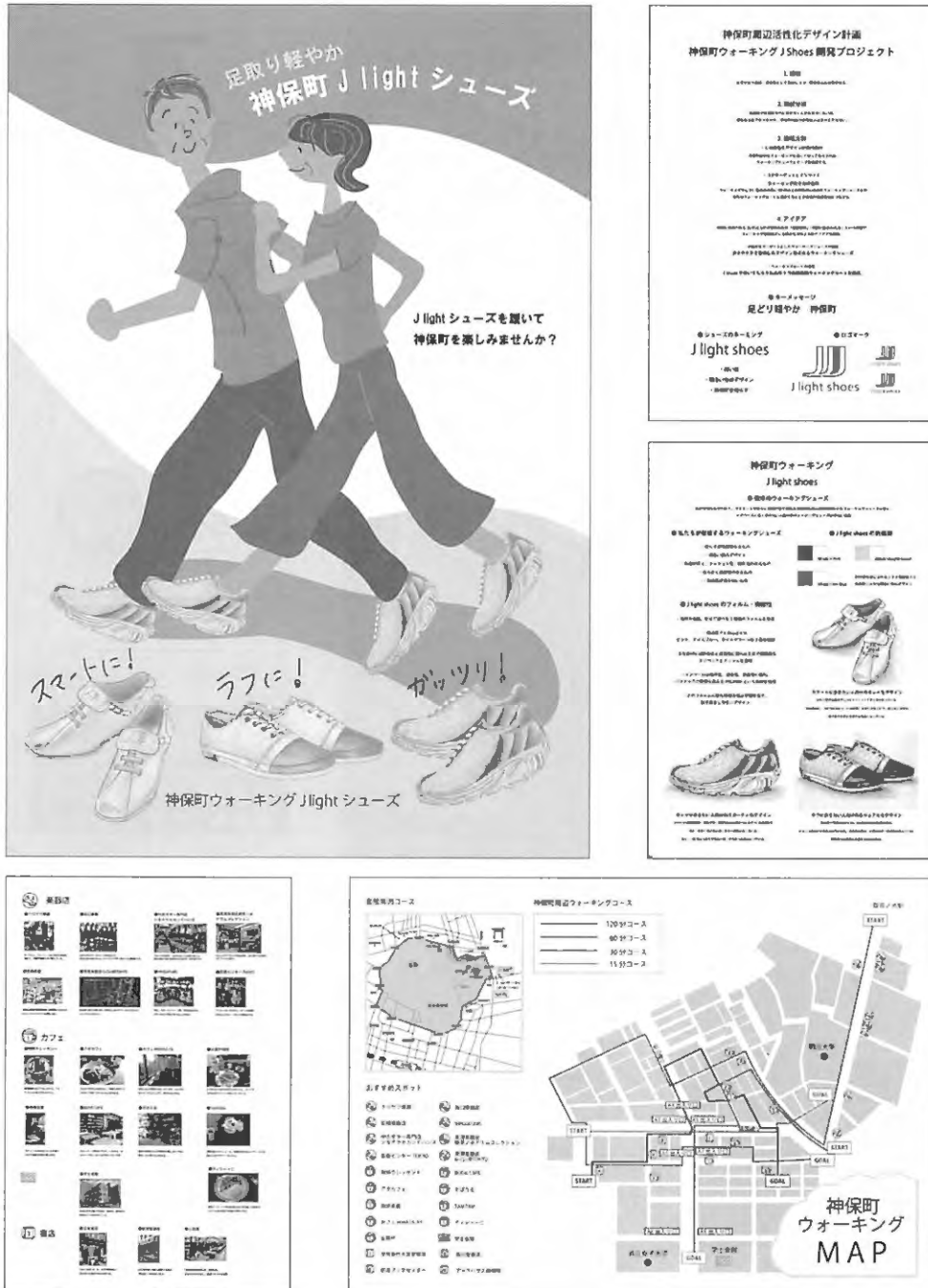
図5 神保町周辺活性化デザイン計画 2016 ⑤ 神保町ウォーキング J シューズ開発・プロジェクト キーマッセージ:「足取り軽やか 神保町」