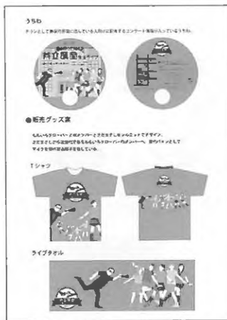
② 共立講堂復活ライブ・プロジェクト