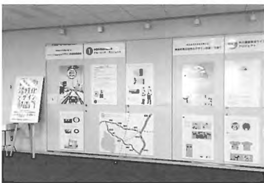
写真6 千代田区図書館『共立女子大学生が考えた神保町周辺活性化デザイン計画提案展示』

2016年10月15日・16日開催の共立女子大学の大学祭（以下「共立祭」）、および平成29年1月23日から3月25日まで千代田区図書館においてパネル展示『共立女子大学生が考えた神保町周辺活性化デザイン計画提案展示』を行い、成果を広く公開した(写真5、6)。前述の6チームのプロジェクトを一つにまとめた「神保町活性化デザイン計画マップ」も制作し展示した(図7)。また、学生編集による作品報告冊子を制作し、展示会場で配布した(図8)。展示を見た方から「展示されている計画はどれも興味