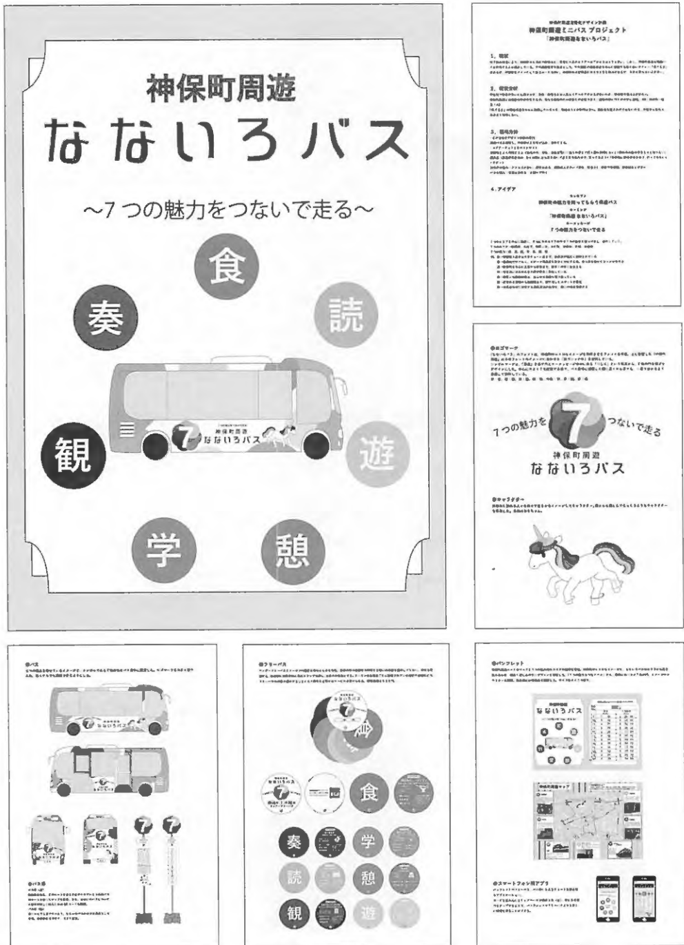
図4 神保町周遊活性化デザイン計画 2016 ④ 神保町周遊ミニバス・プロジェクト キーマッセージ:「7つの魅力をつないで走る」