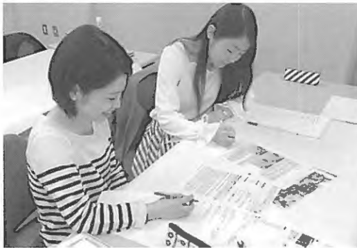
写真1 歴史研究および立地・環境調査をまとめる学生