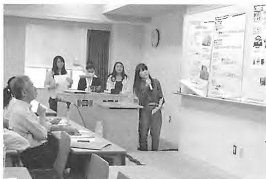
写真3 中間発表会の様子