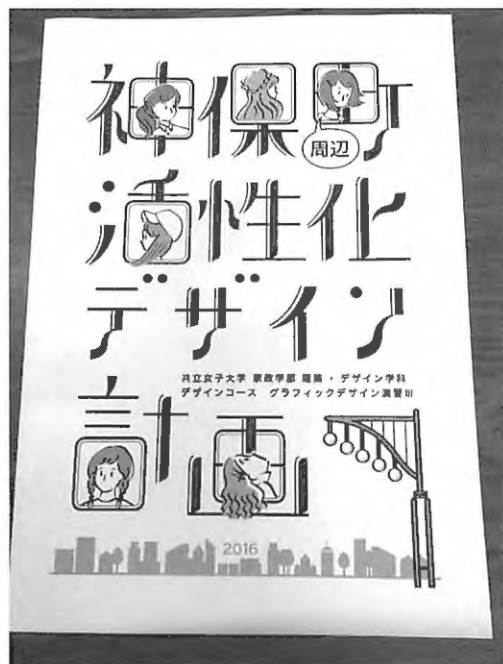
図8 展示会場で配布した冊子「神保町周辺活性化デザイン計画 2016」