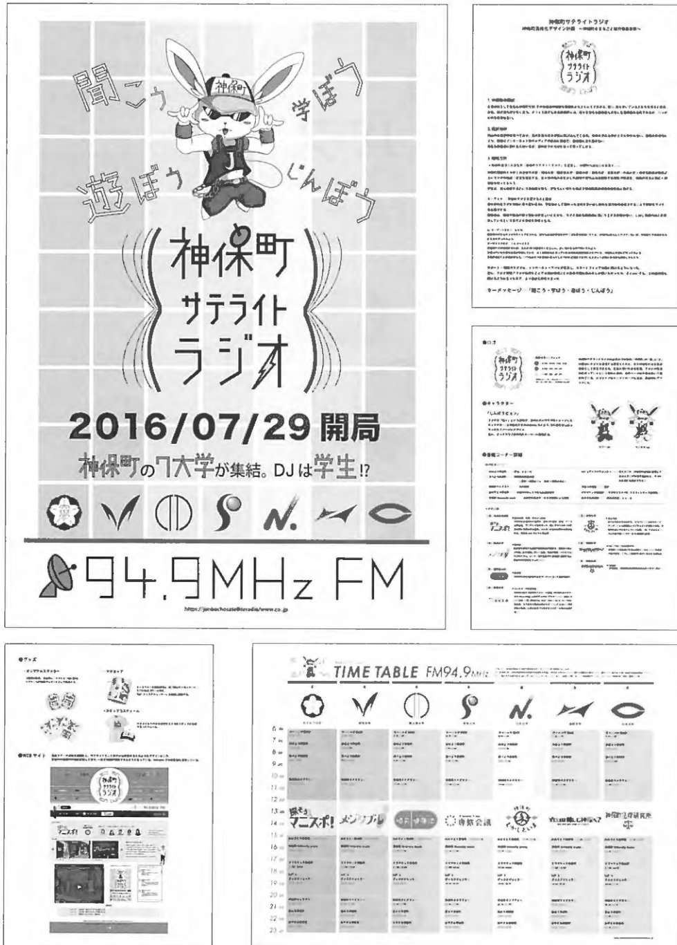
図3 神保町周辺活性化デザイン計画 2016 ③ 神保町サテライトラジオ設立・プロジェクト キーメッセージ:「聞こう・学ぼう・遊ぼう・じんぼう」