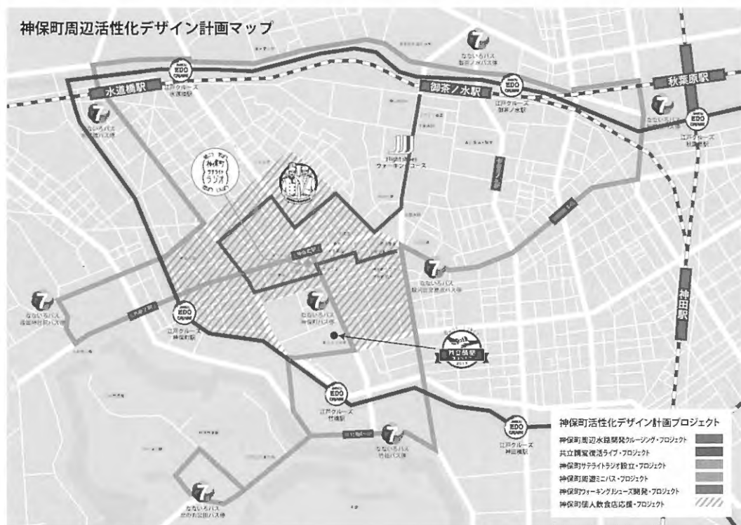
図7 神保町周辺活性化デザイン計画 2016 マップ