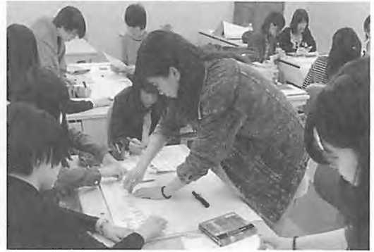
写真2 中間プレゼンテーションに向けて模造紙にコンセプトをまとめる学生