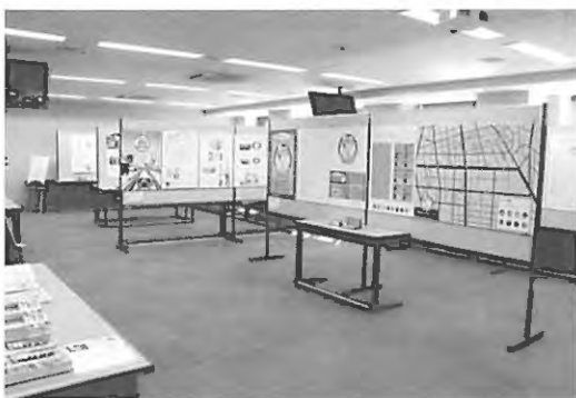
写真5 共立女子大学の学園祭（共立祭）パネル展示

来場者は合計170名でその所属は在校生26名、一般49名、卒業生22名、学生家族46名、学内教員8名、その他19名であった。本展を知ったきっかけについては、学内ポスター16名、パンフレット22名、たまたま73名、その他23名であった。