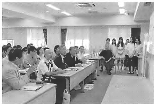
写真4 最終提案・発表会の様子